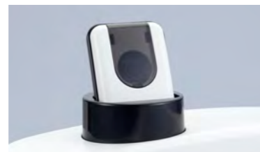
高性能カメラ搭載。 測定者の顔を撮影。 不正防止に役立ちます。