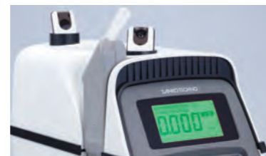
アルコール検知器の精度 を決める心臓部に燃料 電池式センサーを搭載。