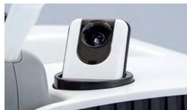
高性能温度センサー搭載。 検温し、測定値をPCに転送。