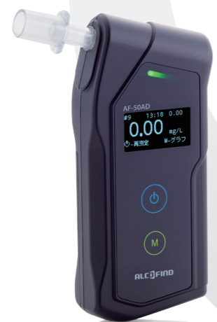
呼気アルコール検知器